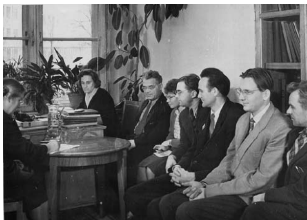
Сотрудники кафедры ТВН, 1963 г.