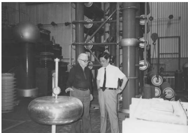
Высоковольтный зал кафедры, 1992 г.

монография по численным методам расчетов электрических полей сложной конфигурации и успешно защищена докторская диссертация.