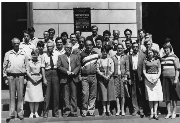
Общее фото кафедры, 1986 г.

В 1986 г. кафедра ТЭВН стала лучшей среди кафедр энергетических факультетов института.