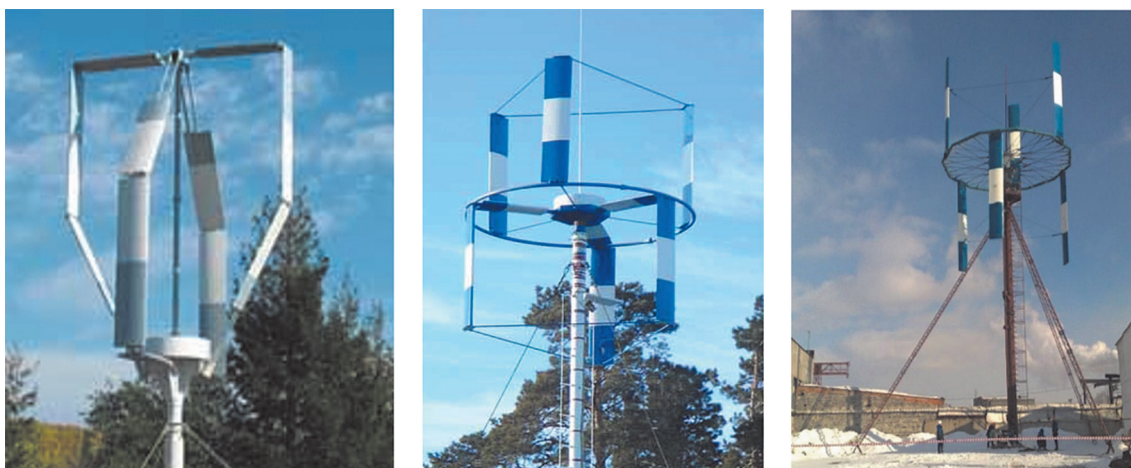
Рис. 2. Ветроэнергетические установки с вертикальной осью вращения

Несмотря на высокий темп развития технологий производства солнечных панелей, до сих пор в эксплуатации находятся панели прошлых поколений, а также панели, требующие дополнительных технических решений для стабильной работы, поэтому оценка степени их деградации должна проводиться своевременно.