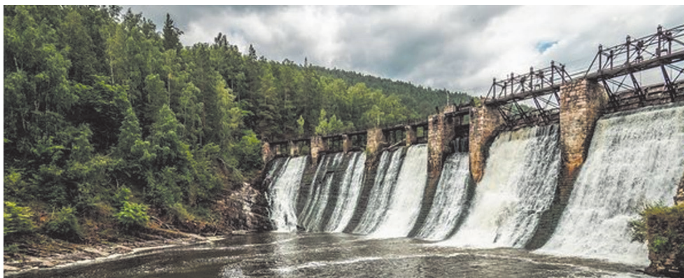
Рис. 3. Порожская ГЭС

Для сбалансированной и согласованной совместной работы солнечной, ветровой и гидро- электростанций, а также интеграции комплекса в электрическую сеть, необходимо провести научные исследования, результаты которых будут использованы при подготовке кандидатских и докторских диссертаций. Планируется